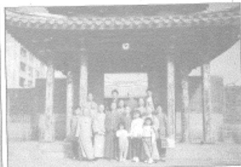
◆研究部校外教學參訪鹿港龍山寺