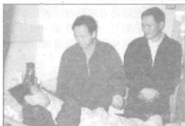
◆福德社服八年，藥性部長最有人緣。