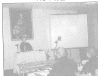
◆清德法師講授妙雲集