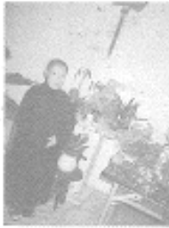
●淨土精舍禮堂一角

【記者謝淑波新店報導】位於新店市青潭的濟公慈航寺住持比丘尼釋普惠，發宏願照顧老人及癌症末期病患，決定將基隆市的住處移作老人福利之用，特別設置「淨土精舍」，期以慈悲心的佛法教育來關懷老人，並幫助癌症末期病人走完人生最後一段路。