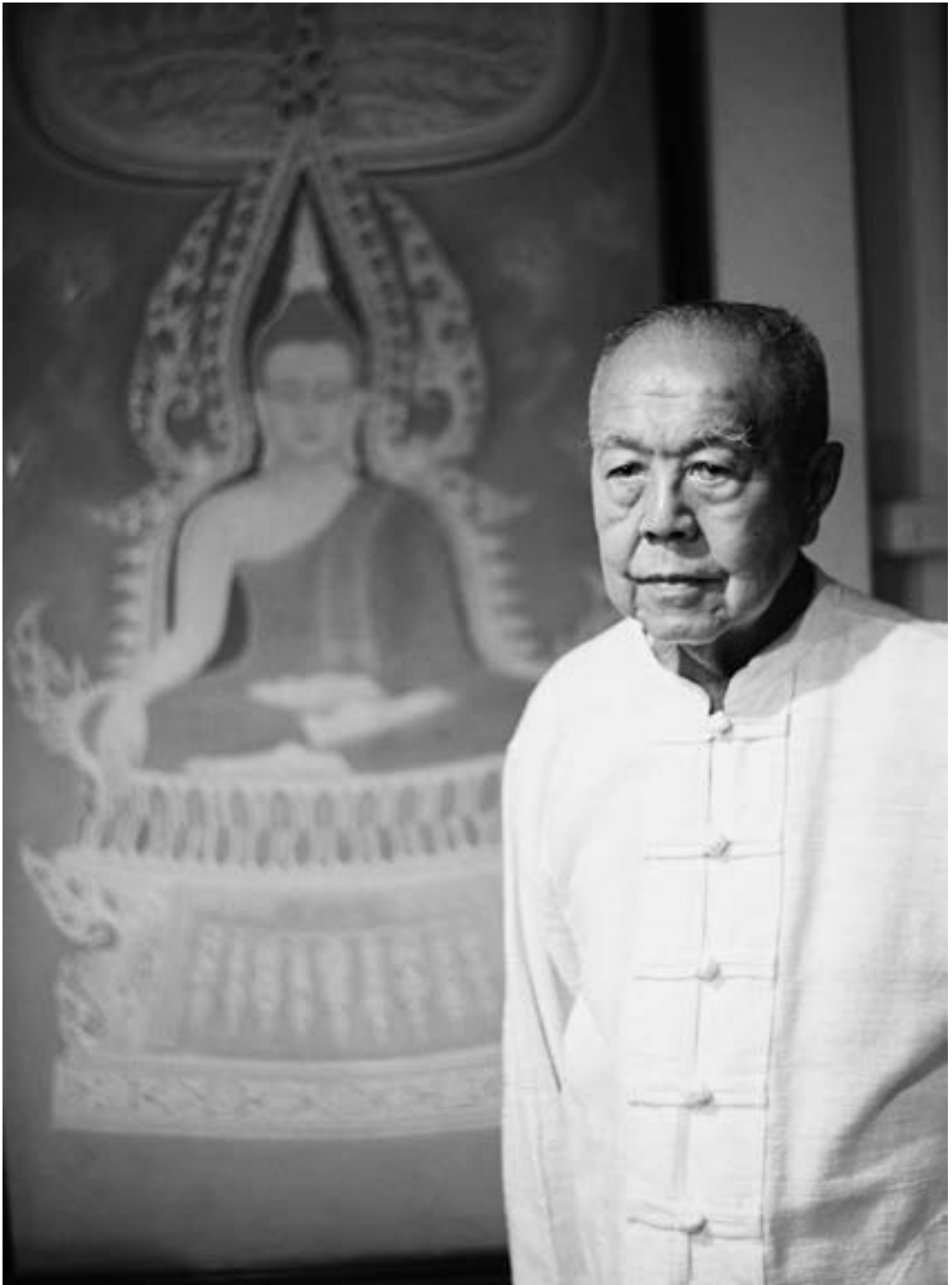
▲兩度獲得諾貝爾和平獎提名、國際入世佛教協會創辦人Ajarn Sulak Sivaraksa。