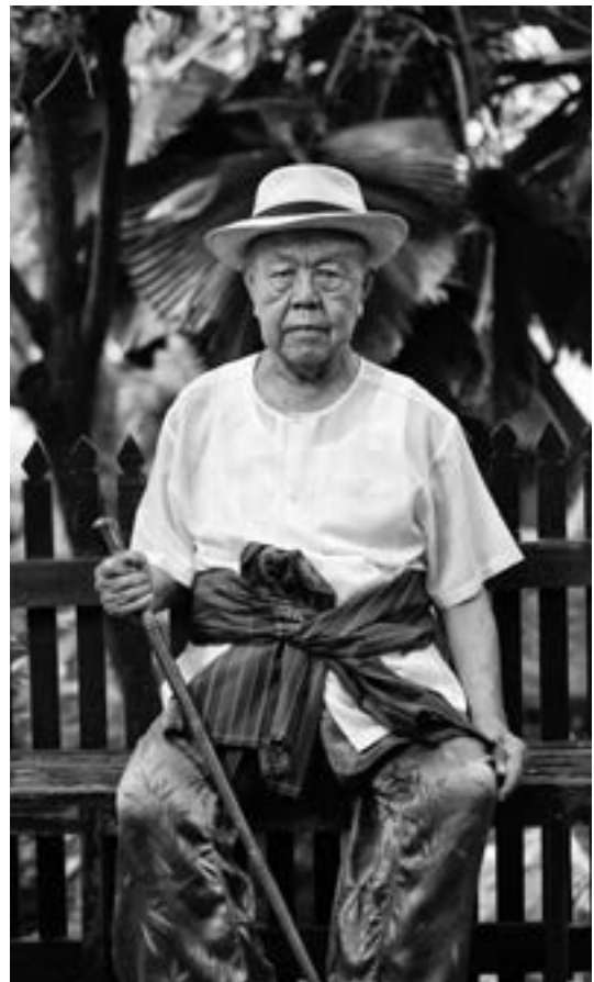
▲ Ajarn Sulak攝於家中，2016年11月。