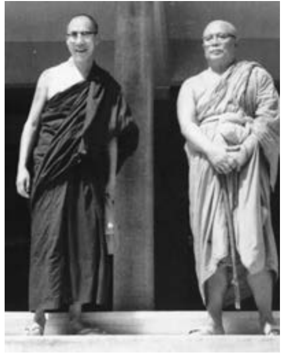
▲1972年，佛使尊者（右）歡迎達賴喇嘛（左）蒞臨「解脫自在園」禪修中心。

順便一句，伊藤友美代表了日本年輕一代佛教學界的新學風（伊藤出生於1971年），英、泰語流利，熟悉社會科學問題，不再只是走日本學界自明治維新以來，據19世紀德國印度學（Indologie）和比較語言學（Comparative Philology）傳統所建立的德式