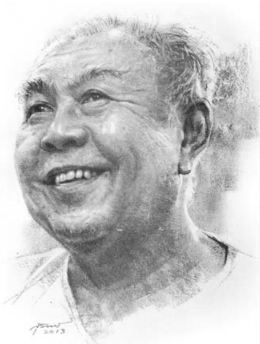
▲ Ajarn Sulak畫像。泰國畫家Suwit Jaipom繪。

前 數星期讀畢有關當代泰國佛教社會運動元老素叻·司瓦拉差（Sulak Sivaraksa, 1933~。游祥洲教授以仿華人姓名的方式，將其泰文名字譯作甚見風雅的「蕭素樂」）的一冊傳記， 1 當中提到，Sulak老師對佛使比丘（Buddhadasa, 1906-1993）執弟子禮，視佛使為影響他甚深的幾位僧侶之一，他在1990年前後以弟子身份出任佛使著作或研究的論文集編輯。此前我一直不知