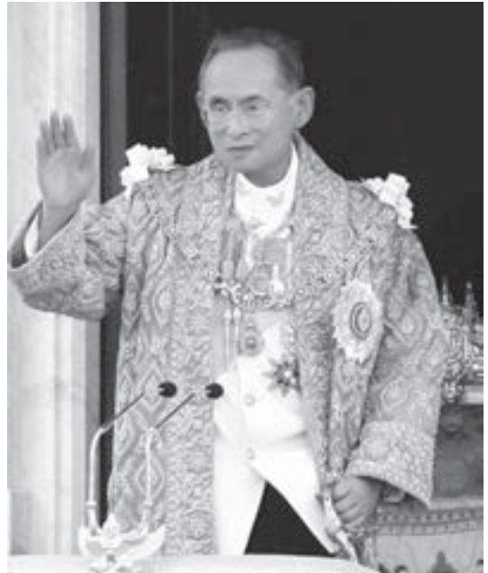
▲ 泰皇蒲美蓬（Bhumibol Adulyadej），拉瑪九世。

今天則讀了泰國學者Pataraporn Sirikanchana 1985年在美國University of