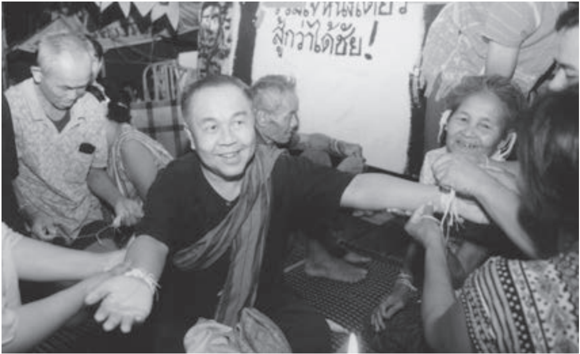
▲在1995年「冒犯皇室罪」審判期間，Ajarn Sulak受到支持者的擁護。

影《獵月：曼谷十月事變》（ http://www.youtube.com/watch?v=6D_ReUK1Wtc ），就是表述軍方反撲後，逃往農村加入游擊隊的民運學生，如何在數年間因泰共嗜殺而離開之轉折。