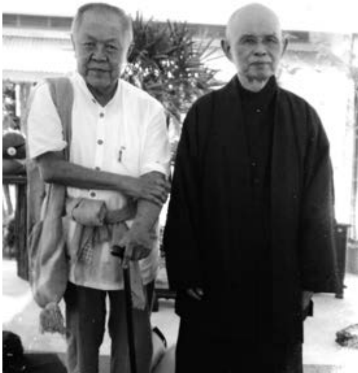
◀ Ajarn Sulak於2013年在泰國 與一行禪師會面。