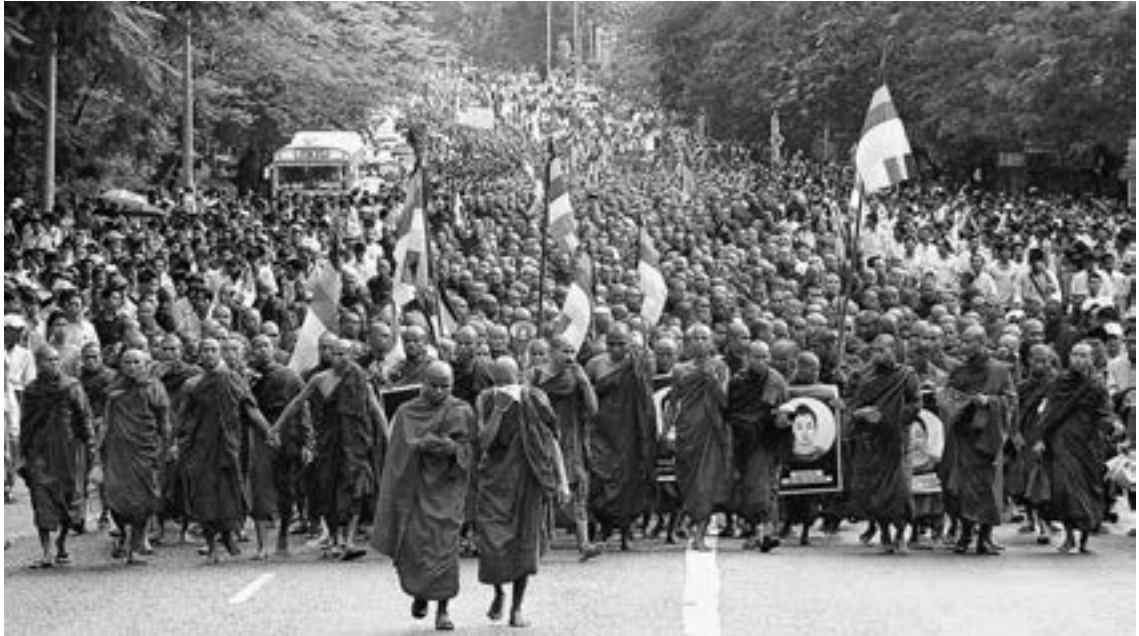
▲2007年9月24日，逾十萬名緬甸僧尼與群眾在緬甸第一大城仰光進行反軍政府示威。

的宗教身份來作區分，這實際上是涉及戰後的泰國作為發展中（developing）的國家，其社會因應美式經濟發展而逐漸呈現出城、鄉差距的格局。在這兩種不同處境下從事佛教公共實踐的泰國僧、俗二眾，他們從成長、族群身份、教育背景、社會暨文化認知、宗教身份、參與社會的脈絡、關注的議題、使用的手段，到面臨的困境和限制，皆有一定的明顯差異。所以以僧、俗區分為線索，這不完全是宗教身份的考慮，更多是循類似社會學的角度，視此為城、鄉差距的折射。