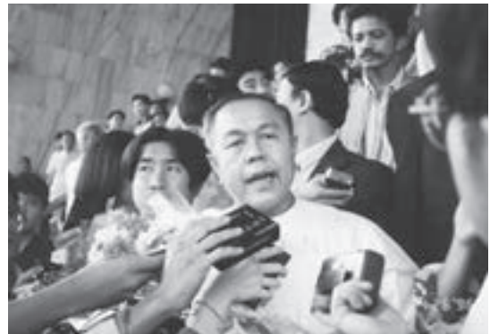
▲1995年Ajarn Sulak在被無罪釋放之後，在刑事法庭外接受採訪。

軍方反撲後很長的一段時間，泰府只容許三類大學生團體存在：扶輪社、佛學社及音樂社。Sulak重施故技，引導大學生的佛學社再一次成為年輕佛教知識份子與新一代社會運動網絡滙流，共同醞釀社運觀念、議題組織及技術更新的場所。醞釀出來的新一代策略，更多是以實務與技術，先著眼民生及社區的具體問題來與官方週旋，而不是首先在政治議題上作直接對抗，從磚石瓦木的民間社區基本建設，累積出整個公民社會的堅固基礎。