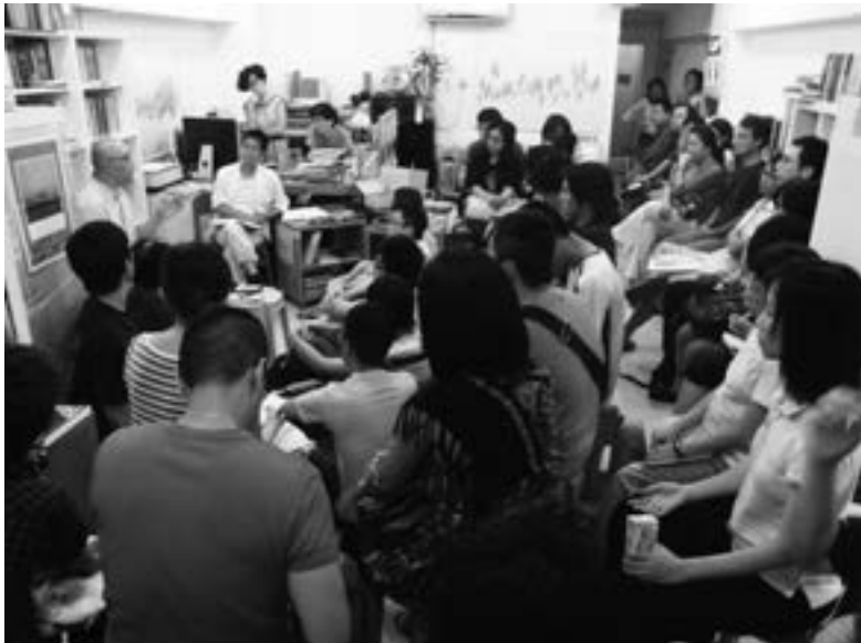
◀ 2008年8月2日，劉宇光教授於香港藝鵠書店演講「Engaged Buddhism左翼佛教」。

國性佛教組織，來探討東南亞社會在僧團之外佛教在社會領域上的公共介入（engagé）。泰國主例會以一僧一俗有師、徒關係的兩個改革者為線索，探討泰國佛教公共介入，即從現代泰國宗教思想革新者佛使比丘（Buddhadāsa Bhikkhu, 1906-1993）法的社會主義（泰文dhammika sangkhom niyom，英譯Dhammic Socialism）到素叻·司瓦拉（Sulak Sivaraksa, 1933-）的左翼佛教實踐。雖涉及二人，但由於後者是在城市中開展社會實踐之在家眾，所以討論的重心會稍多放在素叻·司瓦拉身上，與僧侶在農村的左翼傾向，剛好形成從僧、俗對比而折射出鄉、城的對照。