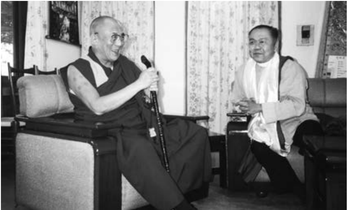
▲1998年於印度達蘭薩拉，Ajarn Sulak拜會達賴喇嘛並致贈一根木製手杖。