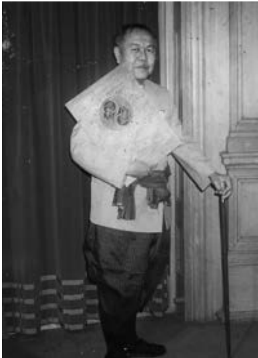
▲1995年，Ajarn Sulak獲頒瑞典「典範生活獎」(Right Livelihood Award)。

明素叻以公民社會觀念作為現代佛教實踐的基本立場之外，也循「異議來成就忠誠」來重新解釋佛教的「善知識」。本章尾聲回顧他的社會行動如何豐富了泰國的公民社會。