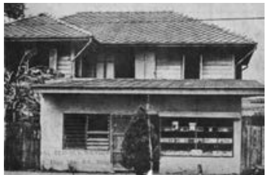
▲ Ajarn Sulak創辦的《社會科學評論》雜誌為泰國民主化發揮巨大貢獻。圖為《社會科學評論》雜誌的辦公處所。攝於1965年。

落在個人心理層面，無論是社運的前線人或策劃人，在上述近乎絕望的情景下，如何維持希望、冷靜、忍耐，應對各種極端負面情緒的輪番轟炸之餘，持續不懈地在日常世界中，不厭繁瑣地展開當時恐怕沒有多少人相信有意義，且需謹慎應對官方敵意的社