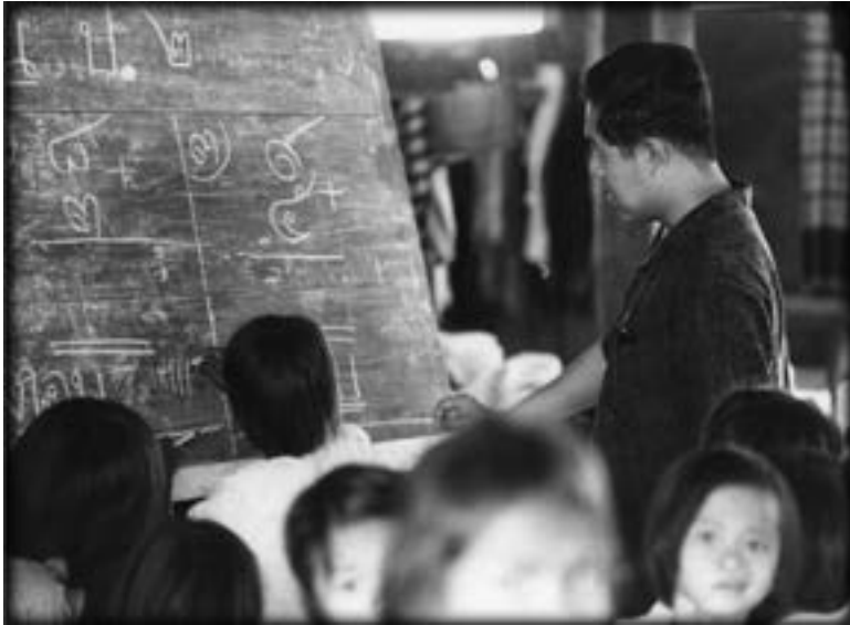
◀ Ajarn Sulak教導泰國村民。攝於1971年。