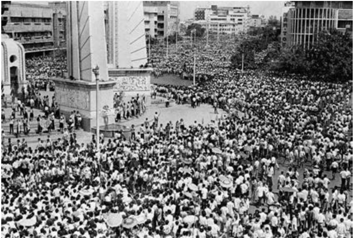
▲約四十萬名泰國人在曼谷街頭示威。攝於1973年10月14日。

保留華人以商營生的傳統外（這關乎生計，當時暹人只務農，生活較辛苦），從語言文字、價值信仰、風俗、教育、心理認同等，均徹底暹羅化，而關鍵就是佛教，所有這類意識形態及符號的全盤轉變，整個都是在上座部身上完成，而且很重要的一點，改變是由下而上的自願改變，不是官方強迫進行。