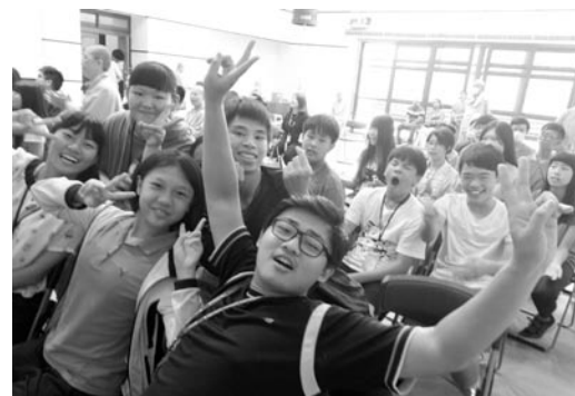
臨別前夕雖然依依不捨，但是每個學員留下歡樂的倩影。(107.7.13)