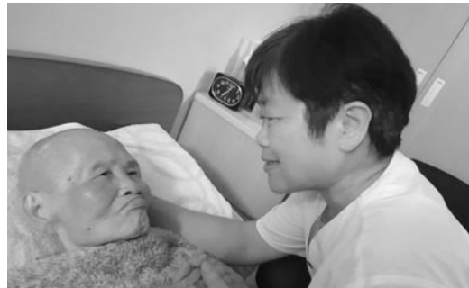
師公靜默注視德風大姐。（107.5.19）

病苦，心不貪戀，意不顛倒，而且念念清明。這是好大的福報，您必將受到佛菩薩的眷顧！」