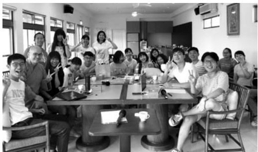
兒童營小隊輔來院進行幹訓活動。(107.6.17)