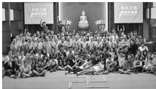
點燈祈福晚會後大合照。(107.7.13)