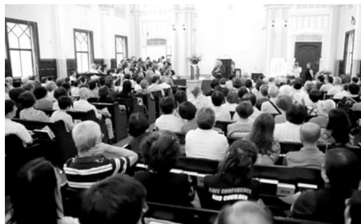
濟南教會禮拜堂座無虛席。(107.7.8)

我在佛典裡也看到一則故事，無著去雞足山專修，求見彌勒菩薩。彌勒是「慈」的意思，亦即：這尊菩薩因慈護眾生而得彌勒之名。無著前後勤修了十二年，卻始終未見到彌勒，曾三次萌生退念。最後出山時，途中見一將死的母狗，被蛆蟲咬食而腐爛，無著生起大悲心，割捨身肉，舌舐蛆蟲，讓蛆和狗都存活下來。這時他忽見彌勒菩薩示現在前。