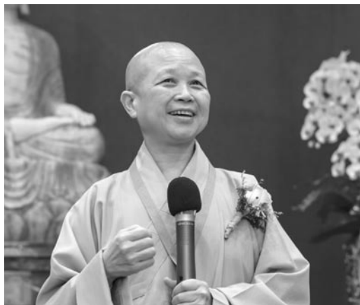
昭慧法師於開幕式中致詞。(107.5.26)

在宗教內部有極大的性別壓迫，用教典的天啟、神聖、權威，形成如空氣般無孔不入的壓迫，更向社會施以魔手形成壓迫，例如對同志、LGBT族群。因此在這個時代，宗教應該要有使命，在教內深切自省，對教外認罪悔改，去聆聽受其壓迫的苦難者的聲音。