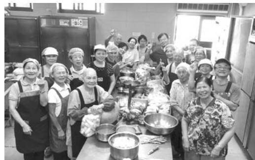
大寮志工菩薩每天烹煮可口佳餚，青年學員直說這麼美味的素食太好吃了。(107.7.13)

院長圓貌法師作佛法開示，期勉青年朋友們以慈悲喜捨的四無量心，作個散播慈愛、具有正向能量的人。然後兩位學員上台分享心得感言，很高興認識不同的朋友，感謝師父們的照顧，學習到包容感恩的心及生活禮儀，相約明年第八屆再相會！