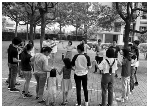
是日，兒童營小隊輔來院進行培訓。(107.6.3)