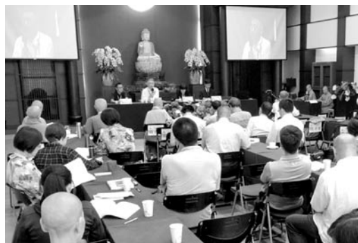
海峽兩岸三地的學者、來賓濟濟一堂。第一會場無諍講堂場景。(107.5.26)