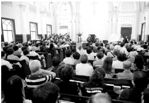
濟南教會禮拜堂座無虛席。(107.7.8)