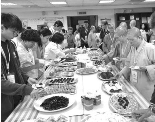
茶點交誼時間，備有精美可口茶點招待貴賓。 (107.5.26)