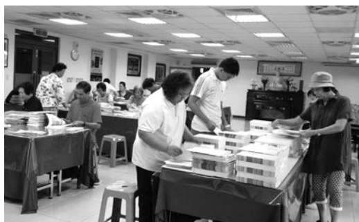
下午，二十多位志工來院協助雙月刊寄發工作。(107.6.15)