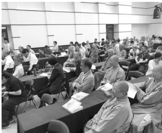
研討會第二天，會場仍坐滿了聽眾。(107.5.27)

現在大陸佛教表面上是很興盛，實際上有很深層的危機。比較保守的、講怪力亂神的，還是佔大多數。但是總的來講，人間佛教在大陸是時代趨勢，假如沒有人間佛教的努力，佛教早就衰敗了。