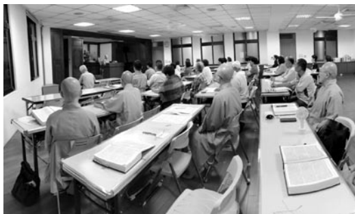
昭慧法師在花蓮慈善寺講授《長阿含經》。(107.6.2)