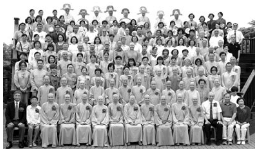
本院舉行研究部暨專修部第十六屆畢業典禮，於韶因觀景台大合照。(107.6.10)

■是日，專修部同學分工合作籌備畢業典禮，有的佈置場地、備辦餐點，有的彩排典禮流程，大家以辦喜事的心情，歡欣迎接每年一度的畢業典禮。