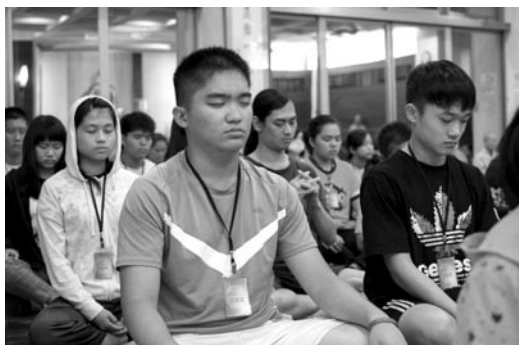
禪修課程，讓青年人在生活忙亂中靜下心來，學習觀照自己的內心。(107.7.11)