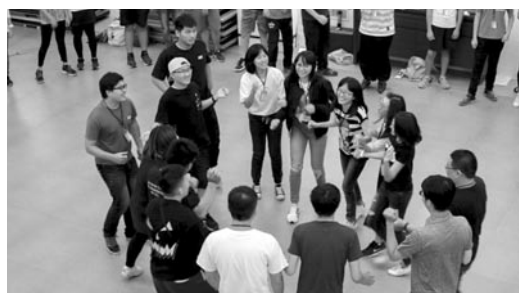
青年營新學員初來乍到進行破冰遊戲，讓彼此熟識。(107.7.10)