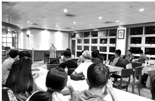
晚上，昭慧法師到東華大學烏頭翁社，演講佛法的「婚姻平權」觀。(107.6.4)

■晚上，昭慧法師到東華大學烏頭翁社，演講佛法的「婚姻平權」觀。慈善寺師父們也想聆聽演講，故開車載法師同去東華大學。法師詮釋佛法視角的「婚姻與家庭」、「人性與情欲」，反同公投與性別教育釋疑。學生們紛紛提問，佛法的智慧、平等與慈悲，令他們耳目一新。