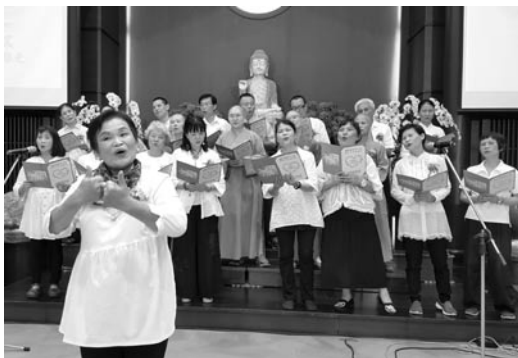
晚上，專修部三年級同學在無諍講堂舉行謝師宴，獻唱手語歌「感恩的心」。(107.6.8)

課堂中，老師將一身絕學傾囊相授；課堂外，同學們請益人生問題，老師總以護念心溫潤每一位學生。我深刻體會到親近善士、聽聞正法的必要，唯有法義的增長才能提醒自己，於懈怠、迷惑、煩惱時，產生一股力量，篤定堅強向前，破除重重障礙。感謝師長們在這三年，陪伴我們一起成長，聞法熏