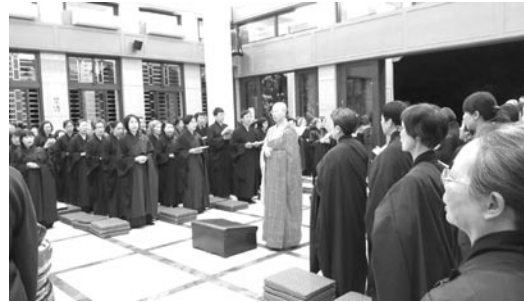
佛七入堂日廣師父領眾熏修。(107.3.11)

「無論遭遇順逆因緣都要以念佛的心來看待，無掛礙，不生貪嗔癡，它是過去做了不好的事所感得的異熟為苦，如果將苦果生起貪嗔癡的因緣與煩惱相應而再造業，那不清淨的無明又造苦果而輪迴。鴛掘摩羅的故事是說心不再造業與煩惱相應，我們將苦果歸依在佛號上，念佛心淨，無明會慢慢遠離而斷除再造業的因緣。造業是錯誤的知見，從心所造，我們以誠懇的心念佛來超越生死，可是因果的罪無法赦免，佛法講緣起，它不是宿命論，鴛掘摩羅因過去無知而造罪，雖然被赦免法律之罰，但是因果之報還有，佛教導他不要再有惡的相繼心，後悔、懊惱都是惡心所，用善念說真語來把惡心所斷絕，一切從心的根源做起，遇到苦報是過去的顯現，放下它，一心向法，向涅槃。」