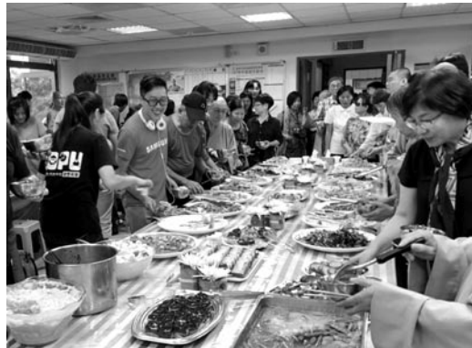
大眾志工組菩薩準備豐盛美味的晚宴招待與會大眾。 (107.5.26)

此次大會來了眾多諸山長老法師及知名學者，激盪出不少知識的火花，讓這善的法流源遠流長，繼續傳承下去，這對整個佛教界來講，有良好的強大推動力。現今社會五倫不常，紊亂不堪，正需要此正知見清流來洗滌淨化及引導。此次論文發表，各有其味，台下學者來賓反應也很熱烈，會議進行得有條不紊，內容的規劃也相當適切，相信明年必能更造高峰。我期盼有更多的學者來賓來參與會議，使法輪常轉，正法永傳！