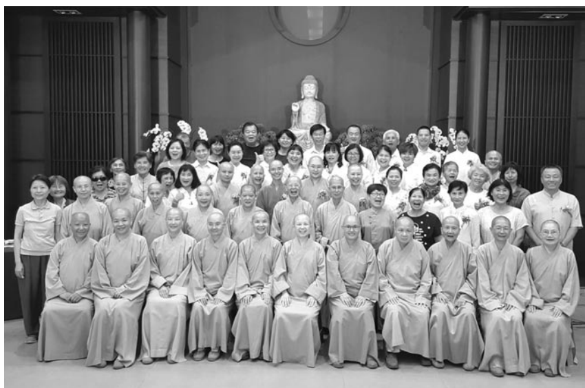
專修部三年級舉行謝師宴，師生、常住與志工歡喜合影留念。（107.6.8）

時間是沈默的音符 無聲息地跳躍過第一年的懵懂無知、尋尋覓覓 節奏劃過第二年的堅持篤定、勇往直前 休止符不代表三年的結束 三年的學習是智慧的累積 成就日後道業的基石