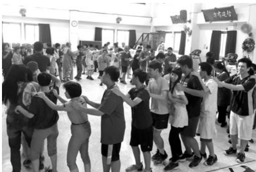
學員以愛心、歡喜心與心燈的大朋友們互動，內心留下深刻的體會。(107.7.12)

弘誓學院近鄰心燈啟智教養院作志工服務，李榮崇院長致詞歡迎並致贈感謝狀。青年朋友們幫忙拔草、整理庭院、參觀教養院，與院生一起同歡，大家手拉著手唱歌跳舞，好不開心！