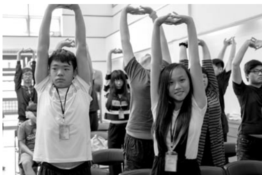
正姿與正知課程，讓青年朋友了解姿勢正確的重要性，要在日常生活多做鬆肩柔膊，鍛鍊健康的身體。(107.7.11)