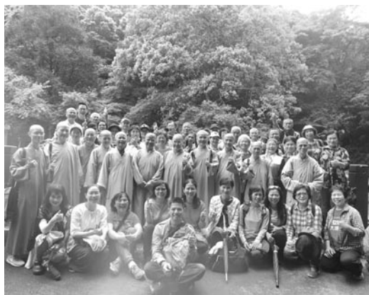
專修部三年級舉行畢業旅行，上午遊覽三峽滿月圓森林遊樂區。(107.4.12)

藉由每次事件，我從中學習，要有一不畏辛苦、勇於承擔的精神，多為大眾服務，關照一切，使其圓滿；也學習承