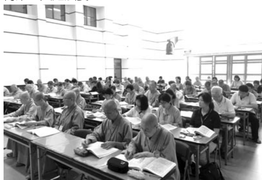
本院舉辦第七期《瑜伽師地論》專題講座，近百人報名聆聽。(107.7.15)

好樂於法，有良師善友的陪伴，真乃成佛之道的善法緣！學員們相互勉勵，互為增上，相約來年再聚，共赴法宴。