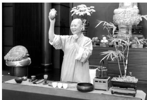
宗禪法師教導學員日式抹茶的心法，讓青年人靜下心來泡一壺明覺之茶。(107.7.13)