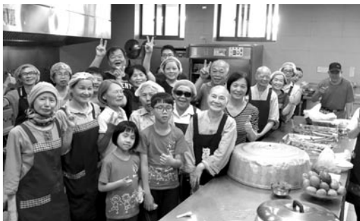
大寮的志工菩薩每餐為小朋友烹煮營養可口的菜色，令大家讚賞不已。(107.7.8)