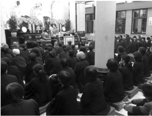
約有150位佛友聆聽大堂開示，大殿座無虛席。 (107.3.14)

力來思考圓滿處理事物的方法，這是世俗的智慧。再者，我們以念佛的清淨心，臨事以無私無我的態度來面對，那麼，念佛的智慧會為生活帶來從容喜悅。