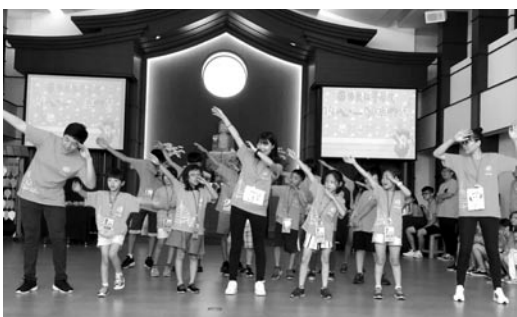
各組小朋友的熱力秀，家長們歡喜看到自己的孩子在營隊中開心學習的成果。(107.7.8)