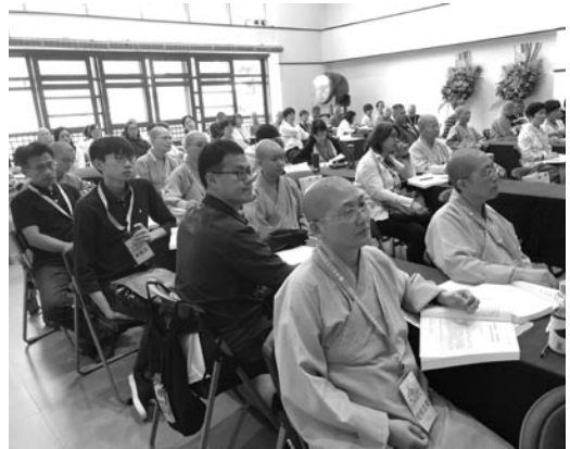
大眾專注聆聽台上學者的精彩論述。（107.5.26）

尋求學術與信仰之間基礎性的共通點。學者和宗教家在目標上會有不同，宗教家出於信仰，會努力建立信仰體系；而學者從事學術研究，則需要盡可能地進行客觀呈現，追求歷史事實。印順作為宗教家，需要建立信仰；而作為一個學問僧，尤其是近現代歷史上有開闊視野的學問僧，也必須面對科學對於佛教界的衝擊。導師努力尋求學術和信仰之間共同點，論證與資料具有客觀性，並非單純宗教家的論證，其方法可落實於他所提及的「以佛法研究佛法」，其研究結果值得重視。