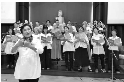
晚上，專修部三年級同學在無諍講堂舉行謝師宴，獻唱手語歌「感恩的心」。(107.6.8)