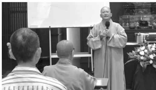
本院舉辦「部派佛教」專題講座，禮請印、中佛教思想史權威悟殷法師主講。(107.7.23)

■本院舉辦為期十日的「部派佛教」專題講座，禮請印、中佛教思想史權威悟殷法師主講，學員有69人。悟殷法師以部派佛教之研究享譽海峽兩岸，以簡御繁，提綱挈領，讓學生對繁瑣哲學的部派佛教，產生研讀興趣，得大法喜。本院每三年一輪開設印度佛教思想史、部派佛教、中國佛教思想史專題講座，甚獲好評。