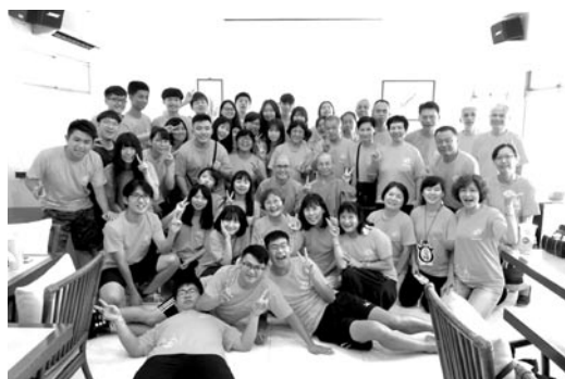
中午營隊圓滿後，工作團隊於嵐園召開工作檢討後歡喜合影。(107.7.8)

孩子學習到不同的成長。接著結營典禮，明一法師致詞、頒發獎項。為期三天兩夜的「開心一夏」兒童夏令營，在小朋友們的歡笑聲中，圓滿落幕。