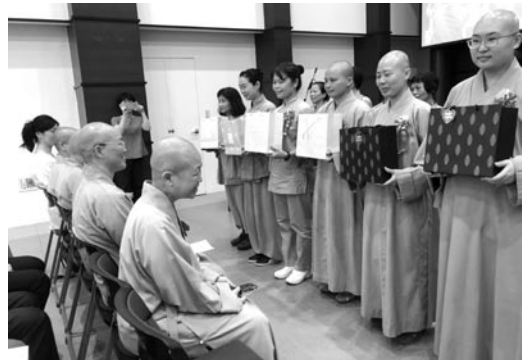
畢業典禮上，畢業生向老師獻禮，感恩師長三年來的法乳深恩。(107.6.10)