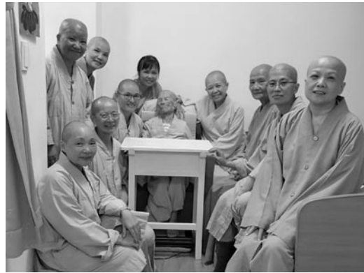
學眾到寮房探望知光師公。(107.3.11)

部分時間都在安睡，床頭間歇播放「南無觀世音菩薩」聖號。湘雲與阿晝的殷勤照護，學眾們的良好後援，確乎讓她相對安適地渡著人生最後階段的臥榻歲月。