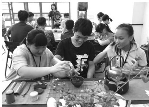
在清雅布置的茶席中，學員們歡喜體驗靜心泡茶的心法。(107.7.13)