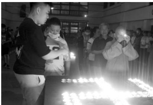
點燈祈福與會者都在佛前獻上一盞心燈，為自己祝福的對象衷心祈願。(107.7.13)