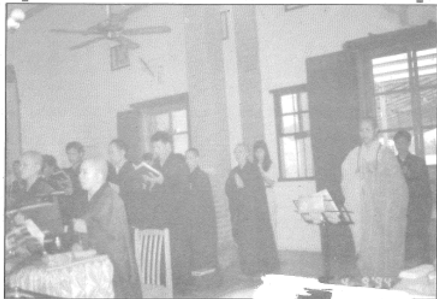
八十三年九月四日・雙林寺・地藏法會・