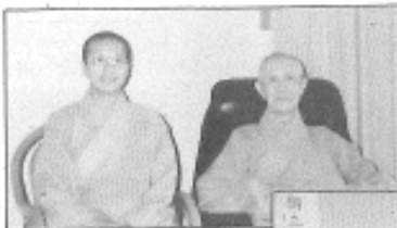
印順導師與性廣法師 ·華雨精舍