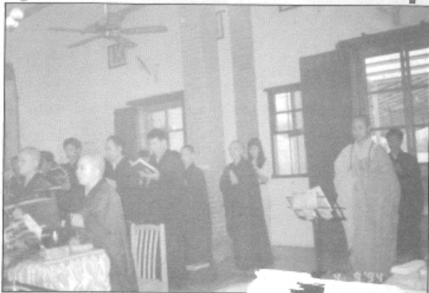
八十三年九月四日·雙林寺·地藏法會·