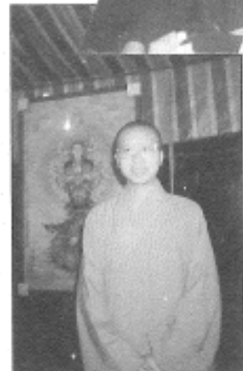
性廣法師·七號公園護觀音