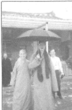
印順導師與昭慧法師 ·雙林寺